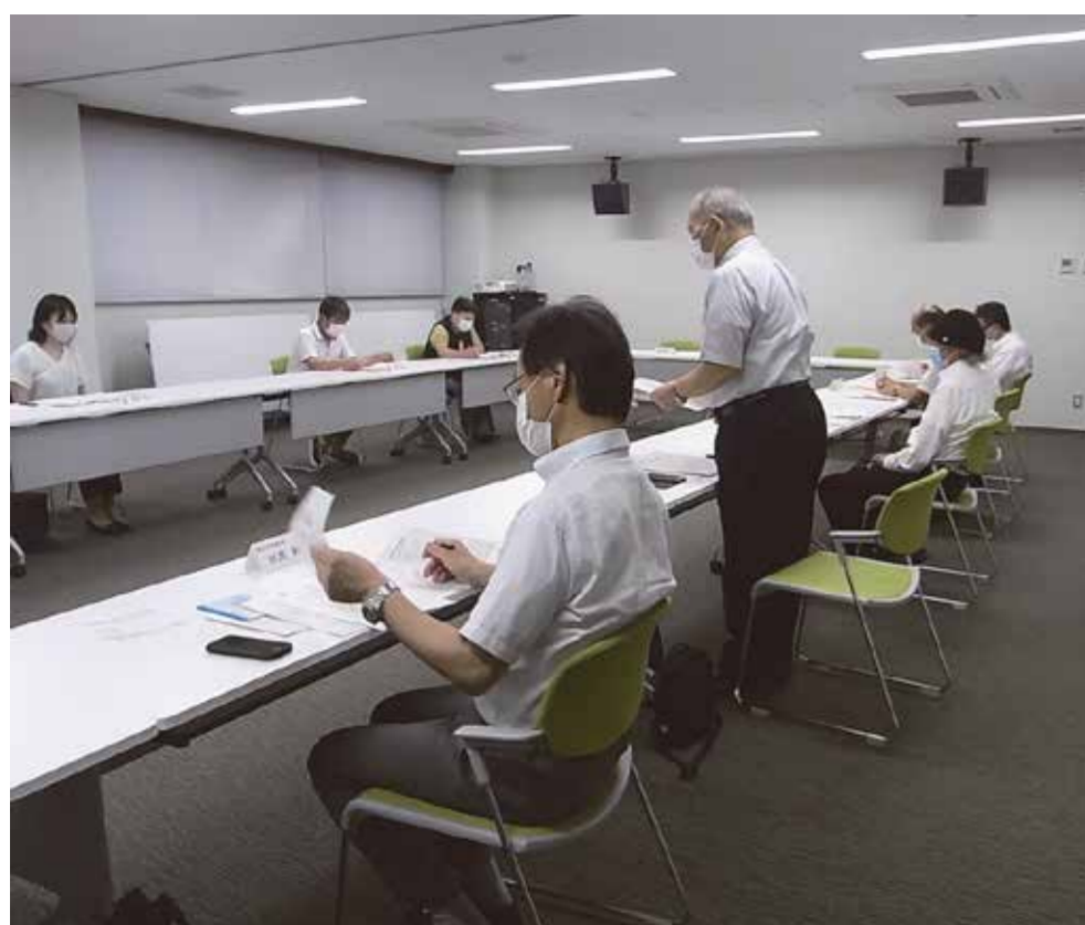
審議会にて議論百出

2016年12月には、障害者差別、外国人に対するヘイトスピーチ、部落差別それぞれを規制する人権3法が施行されました。特に部落差別解消推進法では、「現在もなお、部落差別が存在する」と明言し、「部落差別はゆるされないもの」と人権侵害に対峙する姿勢を明確にしております。そこで、高浜町長が現行条例改正を「あらゆる人権差別をなくする審議会」に諮問し、2019年3月に審議会からその答申がなされました。人権啓発推進本部、高浜町議会で慎重審議を重ね、2020年度内に改正すべく大詰めに迎えております。