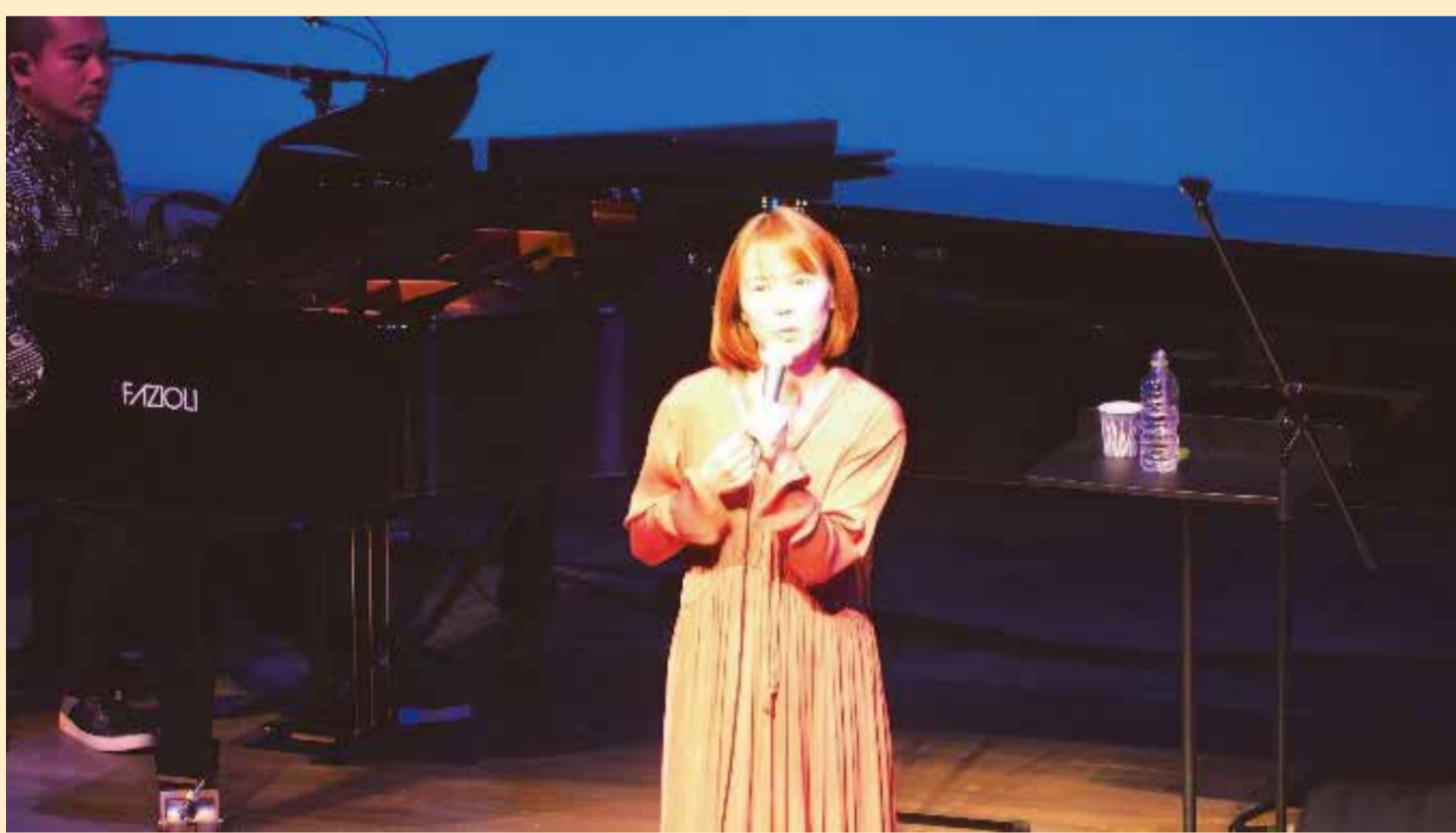
人権のつどい 2019 半崎美子トーク&ライブ R1.12.6 生涯学習センター なびあす

人権について考える場を提供し、一人ひとりの人権意識を高める機会として年間に6回の町民人権講座を行いました。また、多くの町民が参集し、人権の大切さについて感じたり、考えたりする機会とすることをめざし、人権のつどいを開催しました。